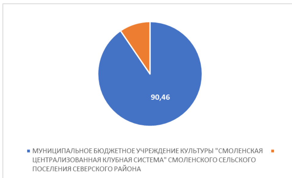
Рисунок 1 – Интегральный показатель по критерию «Открытость и доступность информации об организации культуры»

По первому критерию «Открытость и доступность информации об организации культуры» МУНИЦИПАЛЬНОЕ БЮДЖЕТНОЕ УЧРЕЖДЕНИЕ КУЛЬТУРЫ "СМОЛЕНСКАЯ ЦЕНТРАЛИЗОВАННАЯ КЛУБНАЯ СИСТЕМА" СМОЛЕНСКОГО СЕЛЬСКОГО ПОСЕЛЕНИЯ СЕВЕРСКОГО РАЙОНА набрало 90,46 балла (Рис.1).