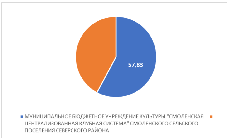
Рисунок 3 – Интегральный показатель по критерию «Доступность услуг для инвалидов»

По третьему критерию «Доступность услуг для инвалидов» МУНИЦИПАЛЬНОЕ БЮДЖЕТНОЕ УЧРЕЖДЕНИЕ КУЛЬТУРЫ "СМОЛЕНСКАЯ ЦЕНТРАЛИЗОВАННАЯ КЛУБНАЯ СИСТЕМА" СМОЛЕНСКОГО СЕЛЬСКОГО ПОСЕЛЕНИЯ СЕВЕРСКОГО РАЙОНА набрало 57,83 балла (Рис.3).