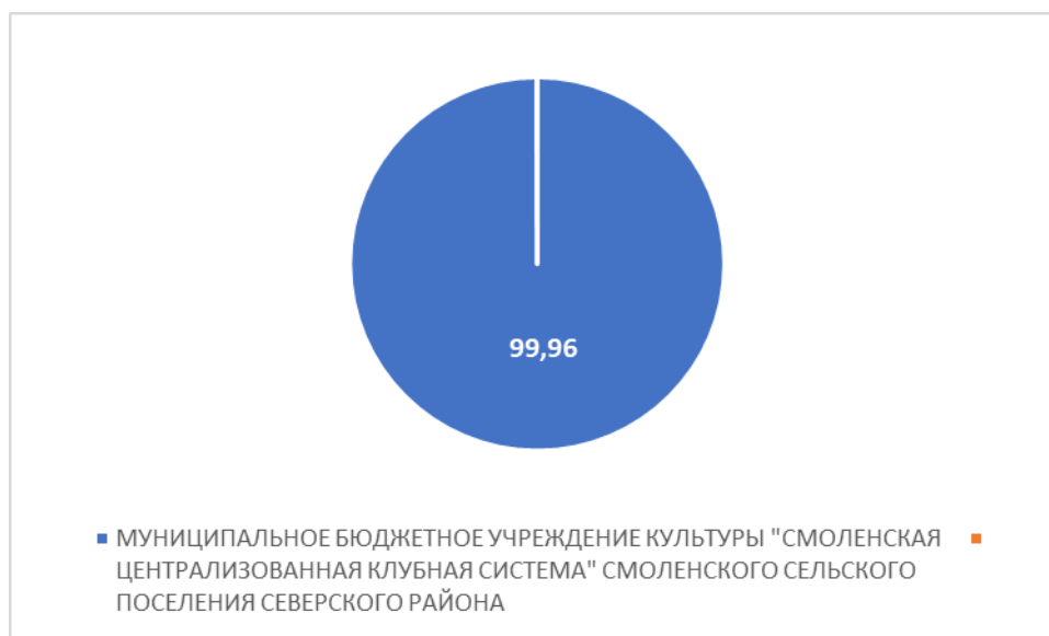
Рисунок 5 – Интегральный показатель по критерию «Удовлетворенность условиями оказания услуг»

По пятому критерию «Удовлетворенность условиями оказания услуг» МУНИЦИПАЛЬНОЕ БЮДЖЕТНОЕ УЧРЕЖДЕНИЕ КУЛЬТУРЫ "СМОЛЕНСКАЯ ЦЕНТРАЛИЗОВАННАЯ КЛУБНАЯ СИСТЕМА" СМОЛЕНСКОГО СЕЛЬСКОГО ПОСЕЛЕНИЯ СЕВЕРСКОГО РАЙОНА набрало 99,96 балла (Рис.5).