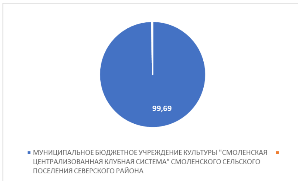
Рисунок 4 – Интегральный показатель по критерию «Доброжелательность, вежливость работников организации»

По четвертому критерию «Доброжелательность, вежливость работников организации» МУНИЦИПАЛЬНОЕ БЮДЖЕТНОЕ УЧРЕЖДЕНИЕ КУЛЬТУРЫ "СМОЛЕНСКАЯ ЦЕНТРАЛИЗОВАННАЯ КЛУБНАЯ СИСТЕМА" СМОЛЕНСКОГО СЕЛЬСКОГО ПОСЕЛЕНИЯ СЕВЕРСКОГО РАЙОНА набрало 99,69 балла (Рис. 4).